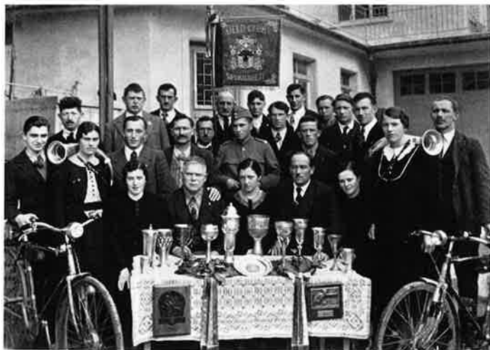
Velo-Club Spiringen 1940