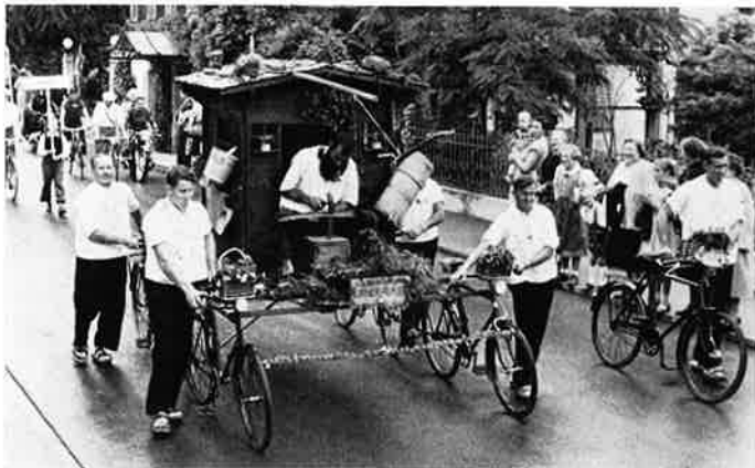
Korso 1953, Brunnen