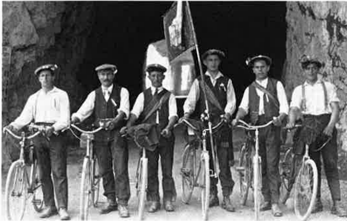
Velo-Club Spiringen auf einer Ausfahrt um das Jahr 1920