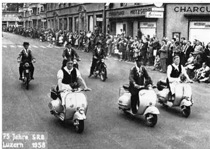
Eine neue Zeit ist angebrochen 75 Jahre SRB, Luzern 1958